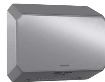
En inox 304 (18/10) Brossé Poli Satiné HyperPolish : AX9531