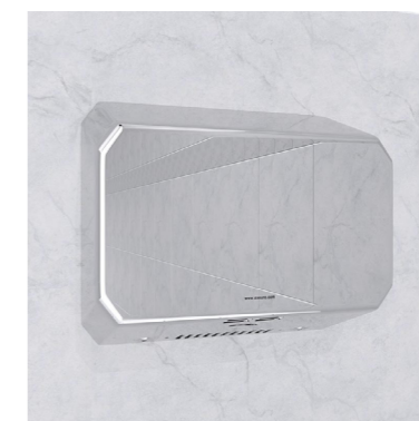
En inox 304 (18/10) Poli Miroir HyperPolish : AX9531P