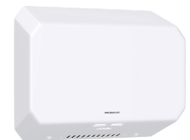
En acier laqué blanc : AX9531W