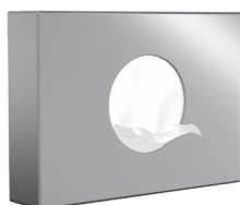
En inox 304 (18/10) Brossé Poli Satiné HyperPolish : AX8414