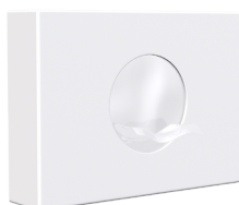
En inox 304 (18/10) Laqué Blanc : AX8414W