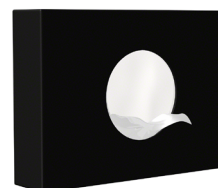
En inox 304 (18/10) Laqué Noir Mat : AX8414-MBK